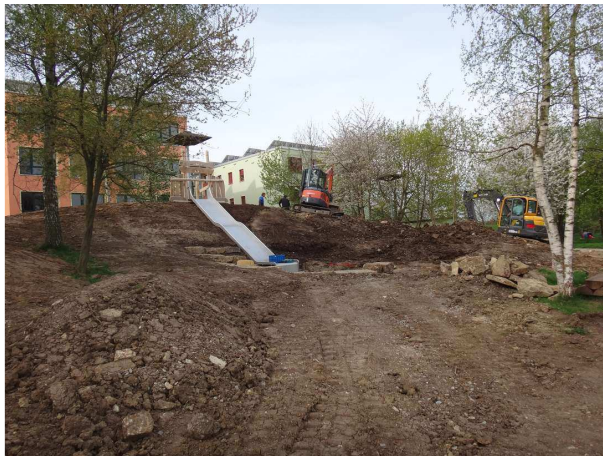
08:45 Uhr: die Bagger sind schon sehr lange am Start