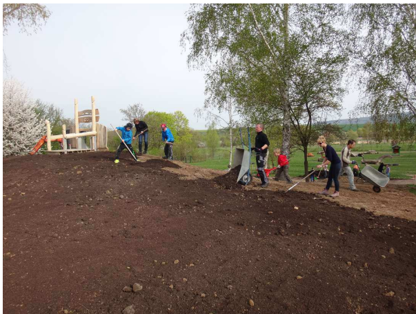
Mutterboden wurde verteilt und...