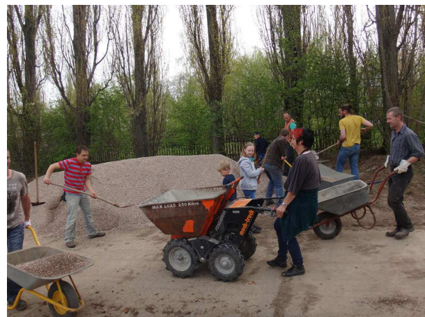
09:00 etwa 20 große und kleine Helfer waren gekommen