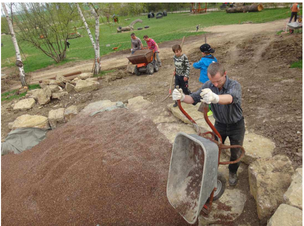
...der Fallschutzkies eingebracht von...