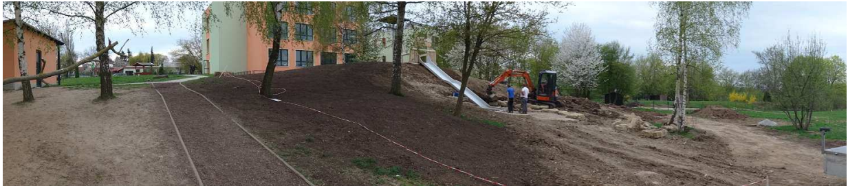
Nahe dem Weg wurde bereits der Rasen angesät.