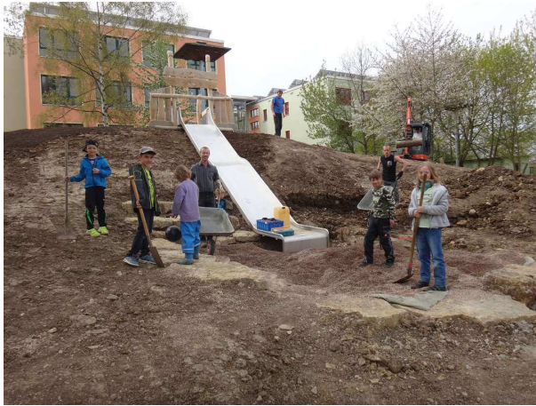
...fleißigen Kindern und...